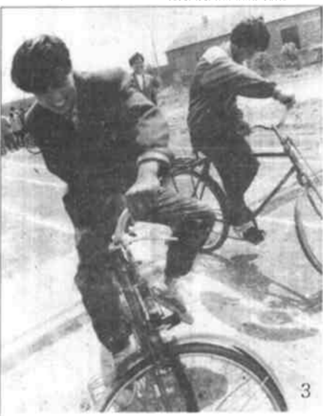
在香港即将回归祖国的喜庆日子里，我市各地到处洋溢着欢歌笑语迎回归的热闹场面：书画比赛、文体活动等，无不寄托着我市广大人民群众对香港回归祖国的欣喜之情。这组照片是部分单位最近开展的迎香港回归文体活动中的一些场面。1、力拔千斤——拔河 2、稳步前进——托球跑 3、慢中取胜——自行车慢骑

以桑梓代故乡：《诗经·小雅》载：“维桑与梓，必恭必敬。后人常以桑梓指代故乡。”（燕翔）